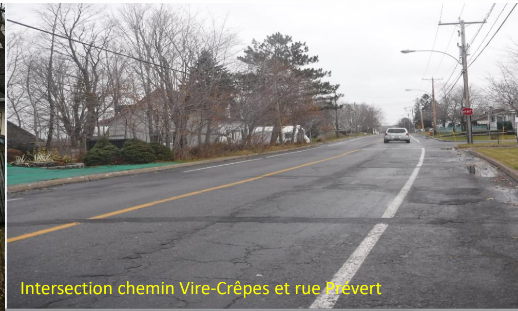
Intersection chemin Vire-Crêpes et rue Prévert