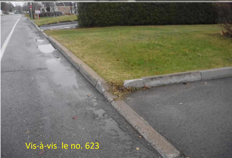
Vis-à-vis le no. 623