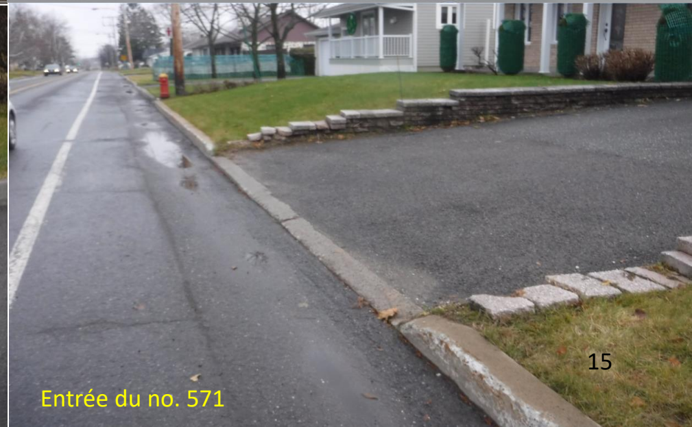
Entrée du no. 571