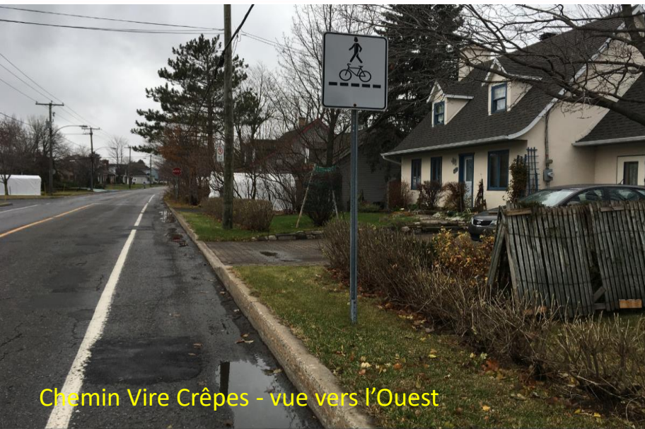
Chemin Vire Crêpes - vue vers l'Ouest